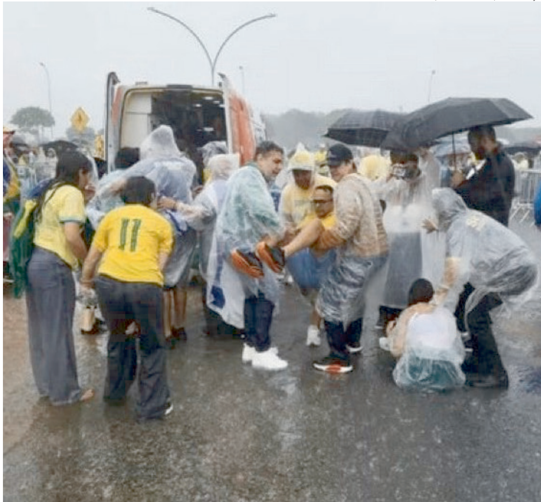
O Corpo de Bombeiros foi acionado para atendimento dos feridos e montou tendas no Memorial JK

O Corpo de Bombeiros foi acionado e montou tendas para atendimento no Memorial JK, que fica próximo à Praça do Cruzeiro. As equi-